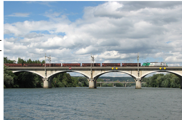
Un train de fret franchit le pont à Sartrouville